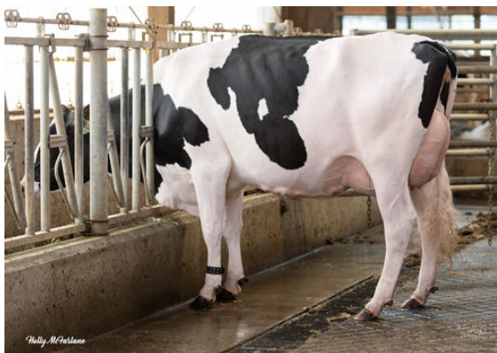
WESTCOAST MAHOMES SKY 12669 DAUGHTER

STANTONS ELDORADO PROGENESIS MILKTIME MIRAGE STE ODILE MILKTIME PROGENESIS MODESTY MISSILE GP-81-2YR-USA 2* BACON-HILL PETY MODESTY OCD DELTA MISSY EX-93-5YR-CAN 6*